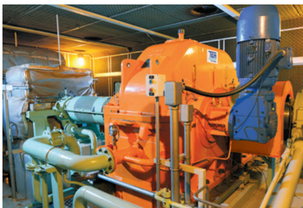
ADECOAGRO - Ivinhema, MS / Turbogenerador - 42 MW SuperTurbo - ST 800