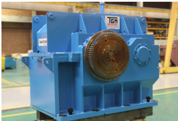
CERVEJARIA MODELO - Mexico / Turbogenerador - 12.7 MW SuperTurbo - ST 630 Y

Algumas instalações de SuperTurbo e Gear Flex