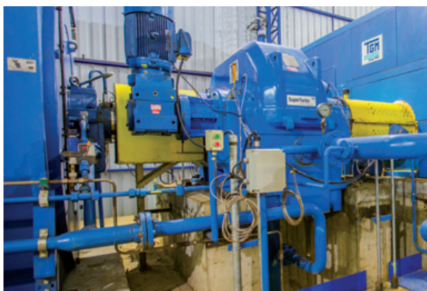
WD - João Pinheiro, MG / Turbogenerador - 32 MW SuperTurbo - ST 710