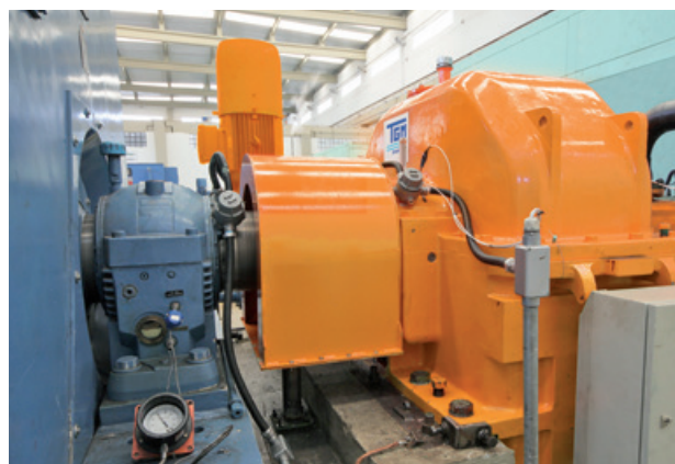
CMAA Vale do Tijuco - Uberaba, MG / Turbogenerador - 49 MW SuperTurbo - ST 630