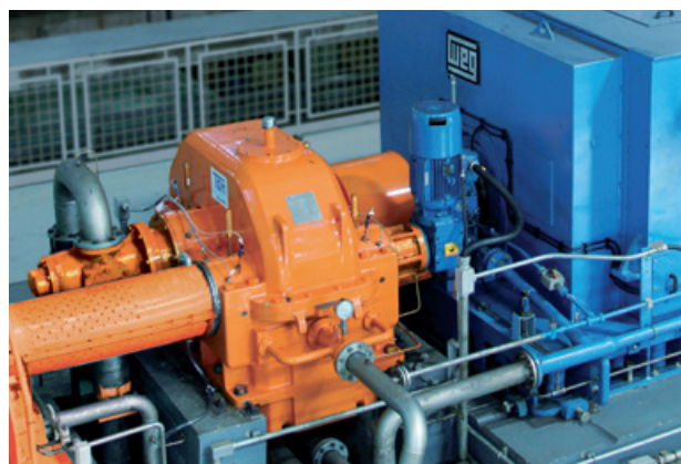
CPFL Bio Alvorada - Araporã, MG / Turbogenerador - 31 MW SuperTurbo - ST 710